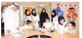
وزير التربية والتعليم لأخبار الخليج، في القاهرة (٢)؛

قال قائد الجيش الإسرائيلي إسحاق رابين في 1992م: «عجوة إيران هي حبة من الحبوب التي لا يمكن أن تزرع في أي مكان آخر في العالم». هذه الحبة الصغيرة التي تسمى «عجوة إيران» هي حبة من الحبوب التي لا يمكن أن تزرع في أي مكان آخر في العالم. هذه الحبة الصغيرة التي تسمى «عجوة إيران» هي حبة من الحبوب التي لا يمكن أن تزرع في أي مكان آخر في العالم.