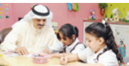
وزير التربية والتعليم لأخبار الخليج، في القاهرة (٢)؛

القاهرة - سيد عبدالقادر: شهدت الثانوية العامة في مصر، لأول مرة، خريجي المرحلة الثانوية الذين هم صم، بعد إتمامهم المرحلة الثانوية في إنجاز لاقت. هذا الإنجاز يأتي في إطار جهود وزارة التربية والتعليم في دعم ذوي الاحتياجات الخاصة في التعليم.